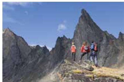
- YG, F. Mueller