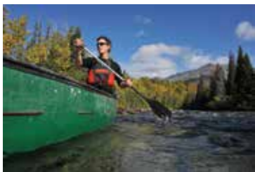
- YG, D. Crowe